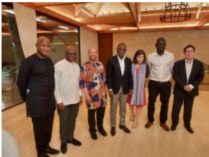
El Primer Ministro, Dr Louis-Georges Tin, entre el Presidente y el Ministro de Asuntos Exteriores de Benin

Después del "Proyecto de Ley destinado a crear el Código de Nacionalidad y Ciudadanía del Estado de la Diáspora Africana", se adoptó otra ley durante la Sesión Plenaria: el "Proyecto de Ley destinado a crear el Código del Estado de la Diáspora Africana sobre Restitución, o Más bien Reconquista".