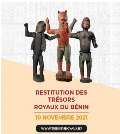
Restitución de los tesoros reales de Benin

BENIN, RESTITUCIÓN, O MEJOR DICHO, RECONQUISTA!