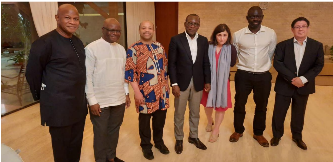
En la casa del Presidente de Benín, para celebrar la devolución de los tesoros