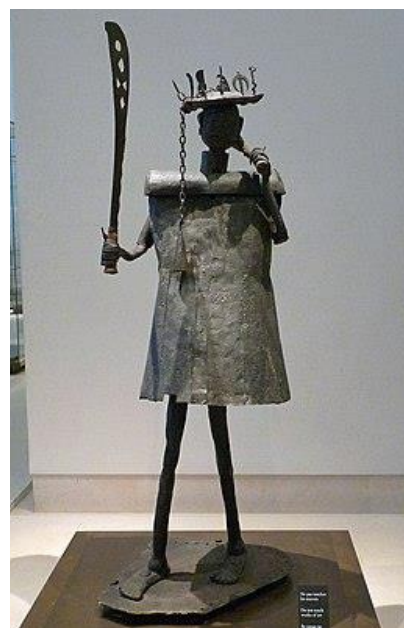
Estatua dedicada al Dios Gou, Museo del Louvre

La campaña sobre Benín está lejos de terminar. 26 tesoros han sido devueltos. Desde un punto de vista simbólico, el resultado es, por supuesto, considerable. De hecho, estos tesoros que los ejércitos franceses habían robado en 1892 están ahora de vuelta en suelo africano. Esta reconquista rompe así la lógica colonial que prevaleció en este campo durante casi 130 años. Para medir su significado, uno debe entender que este evento constituye en cierto sentido el segundo capítulo de la historia decolonial. Primero, los colonos, los invasores, tuvieron que ser expulsados del territorio: esto se ha hecho desde la década de 1960; y luego, era necesario ir a sus hogares, a Europa, para traer de vuelta a casa a África los tesoros que habían robado, y esto ya está hecho.