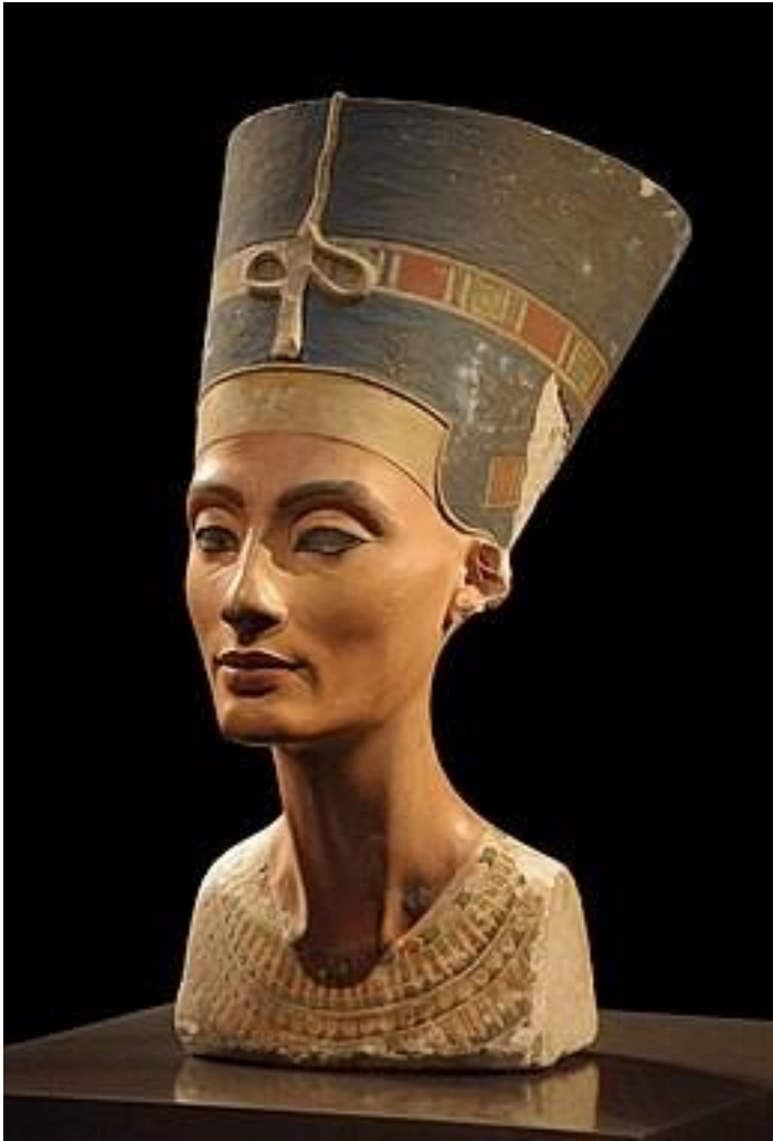
Busto de Nefertiti, Egipto, Neues Museum, Berlín