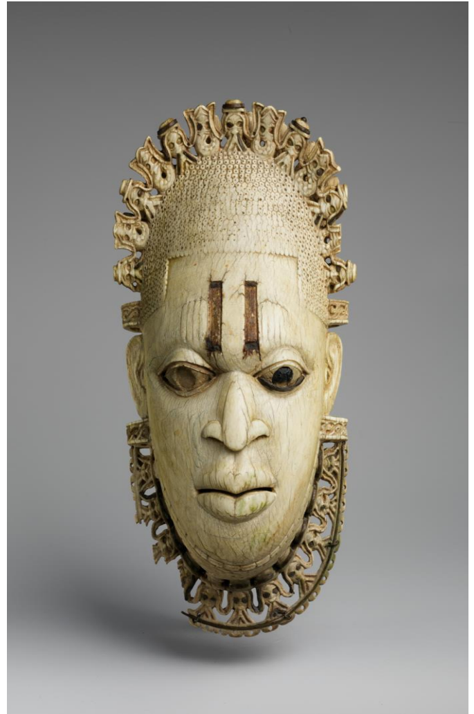
Máscara colgante Reina Madre, Reino de Benín, Nigeria, Museo Metropolitano de Arte, Estados Unidos