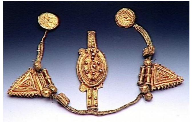
El Tesoro de Ahmadou, Malí, Museo del Ejército, Paris

Dirigido por Theo Chambers, el sitio despierta admiración por tanta belleza, pero también tristeza y enojo, y más que eso, un deseo de movilizarse para que finalmente se pueda hacer justicia para los Africanos.