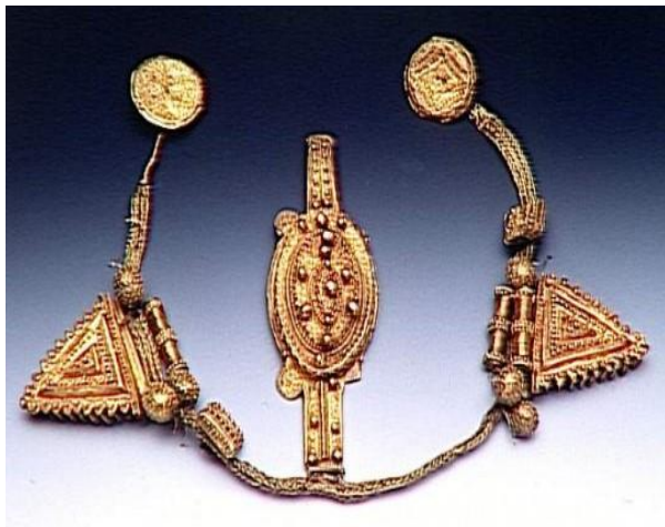
El tesoro de Ahmadou, Mali, Musée de l'Armée, Francia,