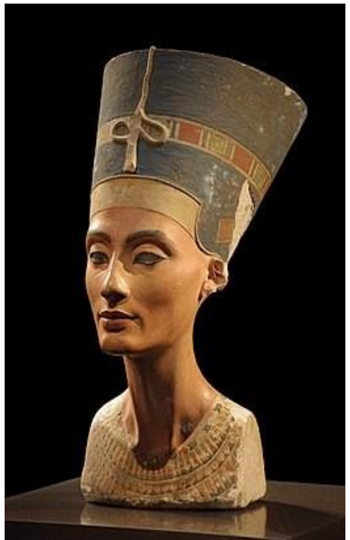
Busto de Nefertiti en París, Egipto, Neues Museum, Berlín