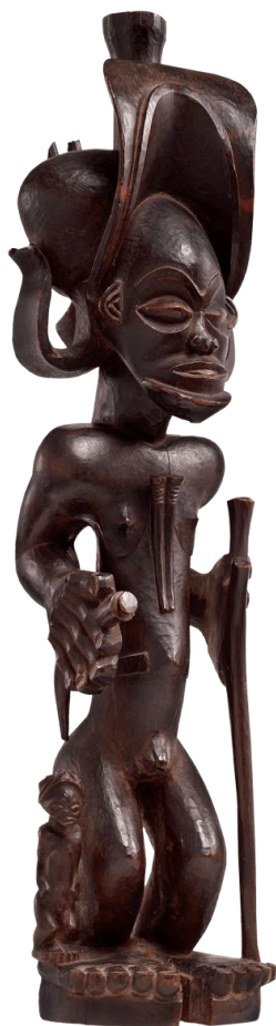
Estatuilla del héroe mítico Chibinda Llunga, Angola, Museo Rietberg, Zúrich, Suiza,

Chibinda Llunga es un héroe legendario, que vivió alrededor de 1600, tenía poderes sobrenaturales e inventó nuevas técnicas de caza. Se casó con Lueji, la hija del rey Lunda. Creada alrededor de 1850 en los talleres de la región de Chokwe, Angola, esta estatuilla representa a Chibinda Llunga con sus enormes manos y pies, un símbolo de fuerza y energía. Su sofisticado sombrero y peinado muestran su origen aristocrático. Hoy la estatua se encuentra en el Museo Rietberg, en Zúrich, Suiza.