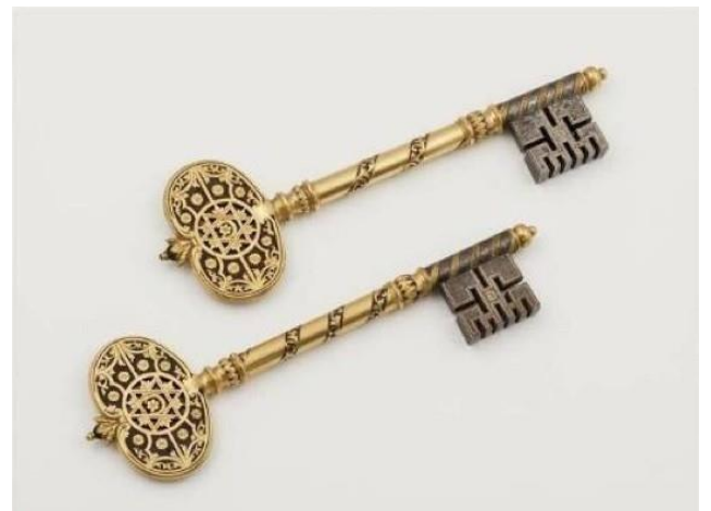
Las Llaves de Argel, Argelia, Museo del Ejército, París

En 1890, en el marco de las guerras coloniales francesas, el coronel Louis Archinard se apoderó de la ciudad de Segou y de los tesoros del soberano Ahmadou, 76 kilos de joyas, principalmente de oro: collares, pulseras, colgantes, etc. Fueron expuestos en el museo del ejército, en el museo de Francia en ultramar, dispersados o robados. Forman parte del patrimonio cultural de Malí.