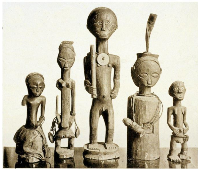
Tesoro de Lusinga, Congo, Museo de Tervuren, Bruselas

Chibinda Llunga es un héroe legendario, que vivió alrededor de 1600, tenía poderes sobrenaturales e inventó nuevas técnicas de caza. Se casó con Lueji, la hija del rey Lunda. Creada alrededor de 1850 en los talleres de la región de Chokwe, Angola, esta estatuilla representa a Chibinda Llunga con sus enormes manos y pies, un símbolo de fuerza y energía. Su sofisticado sombrero y peinado muestran su origen aristocrático. Hoy la estatua se encuentra en el Museo Rietberg, en Zúrich, Suiza.