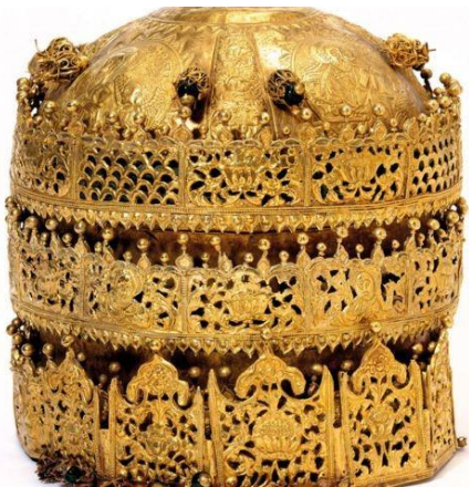
Tesoro de Maqdala, Etiopía, Museo Británico, Londres