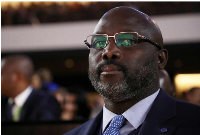
George Weah, Presidente de Liberia

Marzo de 2021 SOAD Y LIBERIA – UNA CUESTIÓN ESPECIAL