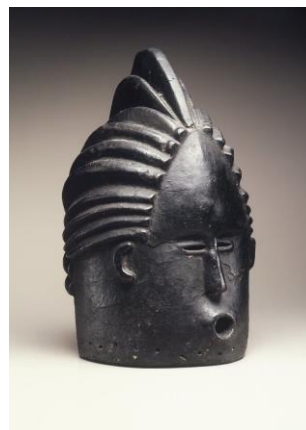
Esta "máscara de casco", hecha de madera y alquitrán, data de principios del siglo XX y actualmente está en la colección del Museo de Brooklyn, en Nueva York. Tomado de Liberia.

El 95 % del legado clásico africano está fuera de África. Es en el Reino Unido, en Francia, en Alemania, en España, en Italia, en el Vaticano, en Suiza, en los Estados Unidos, en todas partes, pero en África. La gente fue asesinada durante estas masacres coloniales, y luego, estos artefactos fueron robados. Sólo en el Museo Tervuren, situado en Bruselas, más de 180.000 artefactos africanos están detenidos. La mayoría de ellos provienen del Congo, donde entre 6 y 12 millones de personas fueron asesinadas bajo el rey Leopoldo, por no hablar de todos los hombres, mujeres e incluso niños africanos, cuyas manos fueron cortadas cuando no trabajaron lo suficiente, según los estándares de los colonos.