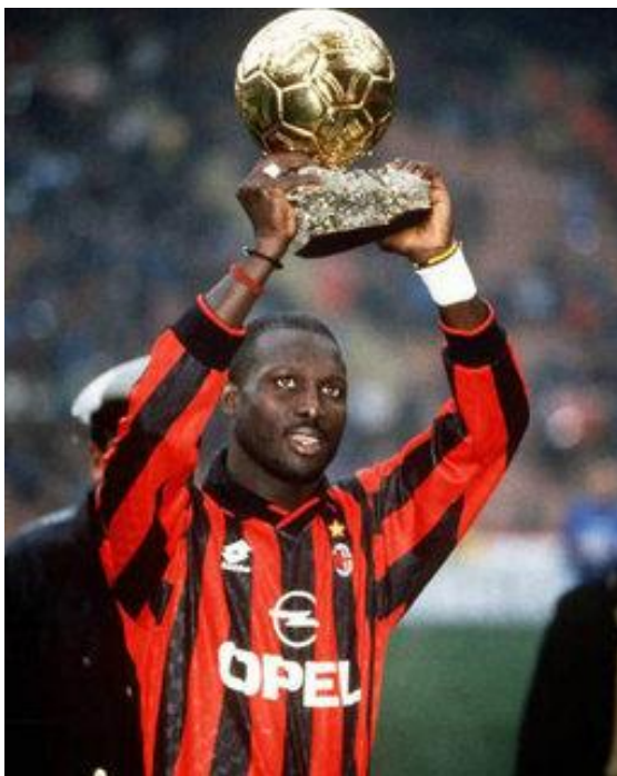
George Weah, 1995

Así, las primeras Olimpiadas Panafricanas tendrán lugar en agosto de 2023, en Liberia. Liberia fue elegida por muchas razones, una de ellas en particular el hecho de que el Presidente de Liberia, Su Excelencia George Weah, fue un gran futbolista, y ganó el Balón de Oro en 1995. Por lo tanto, Liberia, la primera República independiente en África, el símbolo de la repatriación, y un país dirigido por un deportista de clase mundial es realmente para las Olimpiadas Panafricanas el lugar para estar .