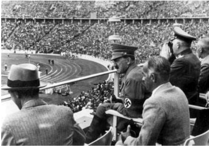
1936 .El campeón olímpico Jesse Owens desafía a Hitler y teorías de la supremacía blanca

Así, las primeras Olimpiadas Panafricanas tendrán lugar en agosto de 2023, en Liberia. Liberia fue elegida por muchas razones, una de ellas en particular el hecho de que el Presidente de Liberia, Su Excelencia George Weah, fue un gran futbolista, y ganó el Balón de Oro en 1995. Por lo tanto, Liberia, la primera República independiente en África, el símbolo de la repatriación, y un país dirigido por un deportista de clase mundial es realmente para las Olimpiadas Panafricanas el lugar para estar .