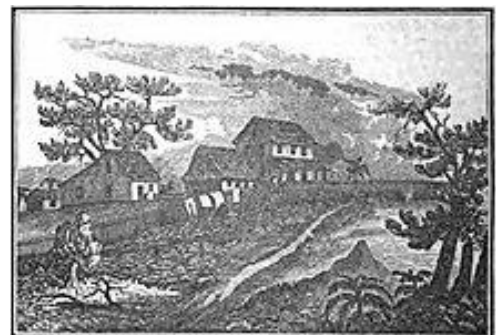
Misión Bautista en Edina. circa 1840