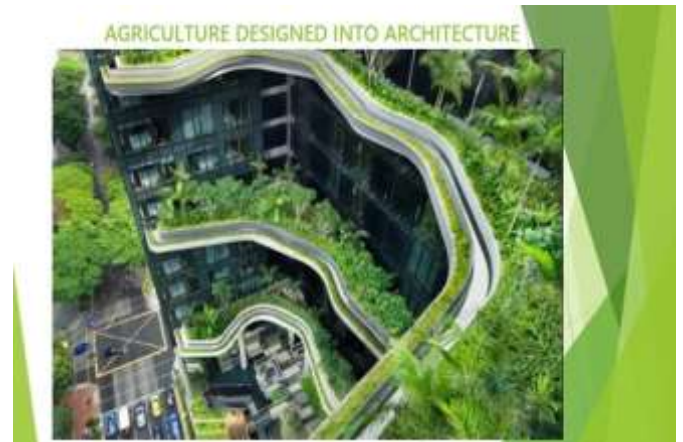
Incorporación de la agricultura a los diseños arquitectónicos

Debemos permitir que la naturaleza haga lo que hace la naturaleza, es decir, crecer, reproducirse y transformar y como seres vivos tenemos la oportunidad de apartarnos de ser sometidos a ciudades puramente de concreto, y pasar a ser espacios integrales con las selvas verdes de nuestras ciudades LUMI.