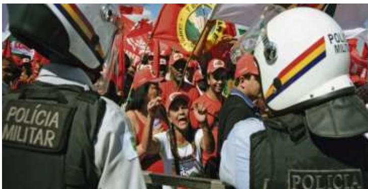
Miembros del Movimiento Sin Tierra protestando frente a la Policía

así como grandes concesiones de tierra e incentivos para la minería depredadora. Por lo tanto, el derecho a la tierra, así como el financiamiento agrícola para las comunidades organizadas en quilombos afrodescendientes, los pequeños productores de la economía familiar y los sin tierra, está cada vez menos asegurado en la política del actual gobierno federal brasileño elegido desde octubre de 2018, así como el respeto por el medio ambiente. : El medio ambiente debido a los incendios en zonas forestales y grandes biomas naturales para fines de ganado y grandes plantaciones también está en riesgo y en este sentido nuestra acción como Banco Panafricano de Desarrollo ECO 6 es esencial en asociación con otras asociaciones de la sociedad civil para garantizar el derecho a la financiación agrícola para quilombos y sin tierra. No podemos descuidar esta lucha que pertenece a todos, así como el caso de la lucha antirracista.