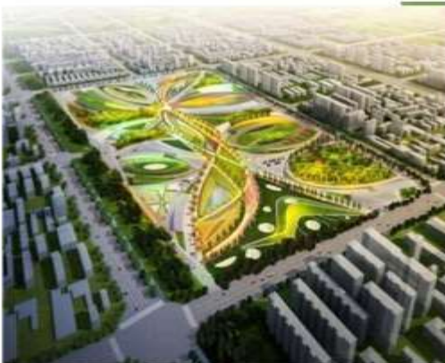
parques agro industriales- agric-parks

Por lo tanto, nuestros intercambios de productos básicos formarán la columna vertebral y el pilar de nuestro movimiento mundial en el comercio de alimentos y en experimentar sin duda la variedad de alimentos y medicamentos que se pueden producir en torno a la diáspora mundial para mejorar nuestra economía y bienestar social, nacional e internacional. Así es como vemos nuestras ciudades inteligentes y la perspectiva del LUMI.