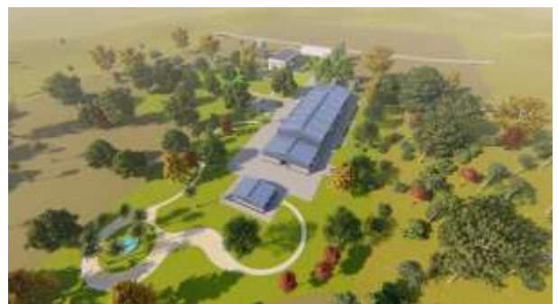
El Complejo para la producción de chooclote tiene cuatro instalaciones: Edificio Principal (1) Adminstrativo, (2)la Fábricay, (3)Centro de Capacitación, (4)Area de Depósito y Lavandería

El objetivo de la política es producir chocolate de alta calidad y poder alcanzar mayor valor agregado. Uno de los miembros de la red recientemente fue galardonado por segunda vez entre cientos de candidatos en una competencia mundial. Esta dispuesto ayudar productores Panafricanos en vias de incremantat el nivel de la calidad de sus productos. Esta es la meta en cada sector.