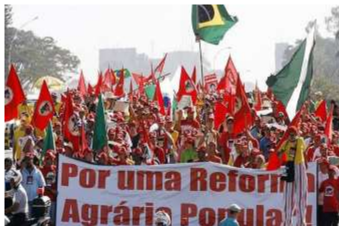
Manifestantes del Movimiento sin Tierra Organizado por agricultores de Brazil

Por lo tanto, el derecho a la tierra en el país es algo que, a pesar del proyecto de Reforma Agraria desde los años 80 y 90, no ha sido ampliamente garantizado, generando conflictos (a veces sangrientos). Con frecuencia ocurre en sectores rurales promovidos por movimientos de lucha por el derecho a delimitar tierras para los sin tierra, como el Movimiento MST Sin Tierra, que a menudo ocupan propiedades rurales improductivas utilizadas para la especulación en las zonas rurales con el propósito de establecer los campamentos de colonos que no cuentan con parcelas asignadas por el gobierno en el proyecto de Reforma Agraria. La política de demarcar la tierra para quilombos (comunidades remanentes de quilombos de descendientes indígenas afro que se resistieron a la esclavitud) y la reforma agraria varía ampliamente de un gobierno a otro. Entre 2003 y 2016, con gobiernos progresistas en el país, miles de hectáreas de tierra fueron demarcadas para quilombos y pequeños productores rurales.