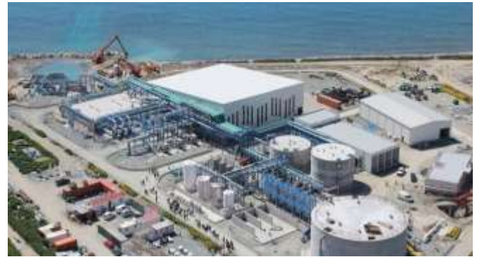
Planta desaladora, Agadir

El Estado de la Diáspora Africana opera tanto en Africa como en la diáspora, nuestro objetivo es reforzar Africa a través de la diáspora, y la diáspora a través de Africa. Uno de los principales desafíos para la agricultura africana es el acceso al agua. Y este problema sólo puede empeorar con el calentamiento global. Más calor significa menos agua, menos alimentos, más hambrunas y también más conflictos, como se puede ver en el este de Africa a lo largo del Nilo, y en muchas otras regiones. Para resolver este problema, Emmanuel Ngombet, Ministro de Infraestructuras de la SOAD, está trabajando en un programa de acción que significa desalinizar el agua de mar y luego transportarla a las tierras áridas del interior de Africa, donde la gente podrá beberla y utilizarla para sus actividades agrícolas. Como resultado, alimentará a sus familias, aumentará sus ingresos, reducirá la pobreza y limitará los posibles conflictos entre las comunidades.