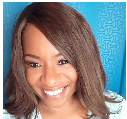
Deandrea Hamilton, MP de Turks y Caicos