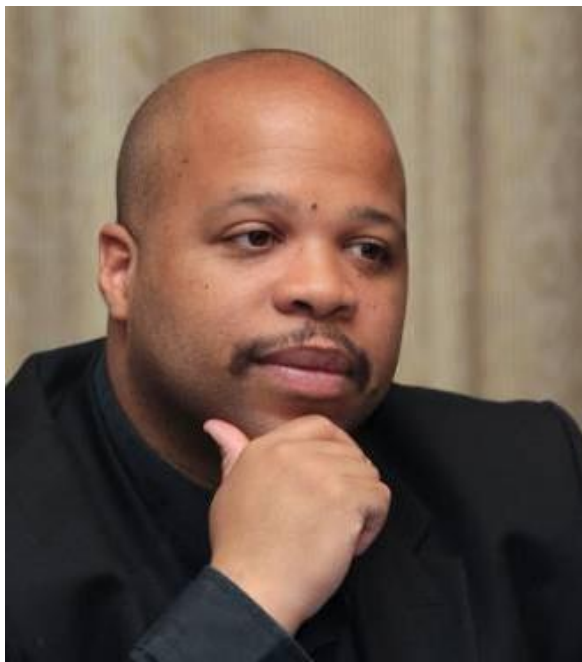
DEL ESCRITORIO DEL PRIMER MINISTRO DEL ESTADO DE LA DIASPORA AFRICANA DR LOUIS-GEORGES TIN