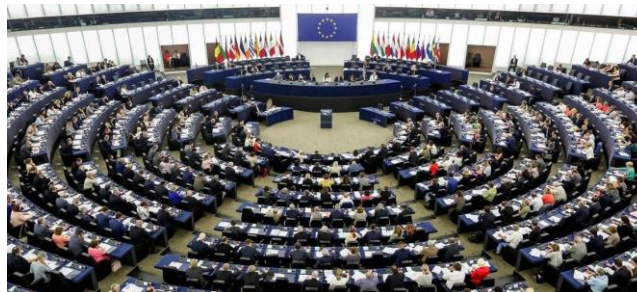
El Parlamento Europeo