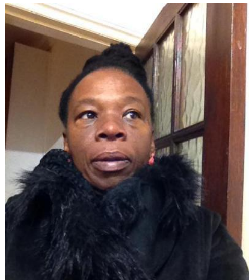
Jasmine Rowe, Embajadora de la UA y Etiopia

El segundo día de diciembre, la comisión electoral contó los votos, según el código electoral previamente diseñado y tomando en cuentas el número de votos por candidato, bajo la responsabilidad de la oficina del Ministro de Asuntos Internos del Estado, se publicó la lista de ganadores. El criterio de escrutinio se basó en la cantidad de votos que obtuvo los candidatos. En una rueda de prensa se anunció los resultados..