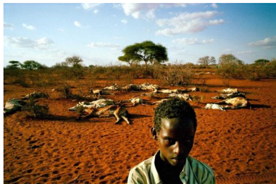
La sequía en el este de Africa

La segunda prioridad, como ya se ha explicado, es la agricultura. El Primer Ministro hizo hincapié en el hecho de que, aunque Africa sólo es responsable del 5 % del calentamiento global, 2/3 de los países más expuestos al calentamiento global son, de hecho, en Africa. Esta realidad también está relacionada con la primera prioridad, la reparación, ya que plantea la cuestión de las reparaciones climáticas (Africa va a pagar por los errores cometidos por otros, ya que los países occidentales se niegan a asumir sus responsabilidades). Antiguamente, en muchos lugares de Africa, había agua, pero no había tuberías para llevar agua a la gente. Hoy en día, con los avances de la infraestructura, en muchos lugares, hay tuberías, pero debido al calentamiento sombrío, no hay más agua en ellos. Sin agua significa que no hay agricultura, no hay comida, y luego no hay vida. Los avances vinculados a las políticas de desarrollo se ven comprometidos por los resultados del calentamiento global. Las hambrunas del pasado, que parecían historia, podrían convertirse en nuestro futuro. Esto es lo que tenemos que evitar. Así, el Primer Ministro presentó el objetivo (seguridad alimentaria), las herramientas (el Intercambio de Productos Agrícolas de la Diáspora) y todos los ministros que tendrán que trabajar especialmente en ese objetivo.