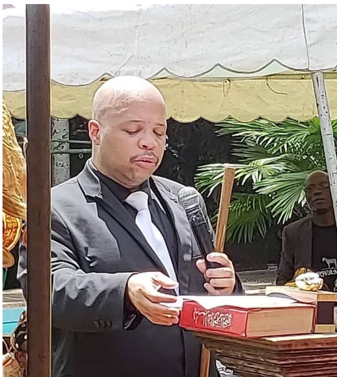
Le Premier Ministre, Dr Louis-Georges TIN, lors de la cérémonie après le Conseil des ministres, jurant de respecter la constitution, et tenant à la main la lance royale offerte par le Conseil panafricain des chefs traditionnels d'Afrique.

L'État de la diaspora africaine a été lancé officiellement le 1er juillet 2018, lors du sommet de l'Union africaine en Mauritanie. Le premier gouvernement a été officiellement présenté en Côte d'Ivoire quelques mois plus tard, en octobre. De nombreux rois sont venus de différentes régions du continent pour soutenir le nouvel État et ses dirigeants.