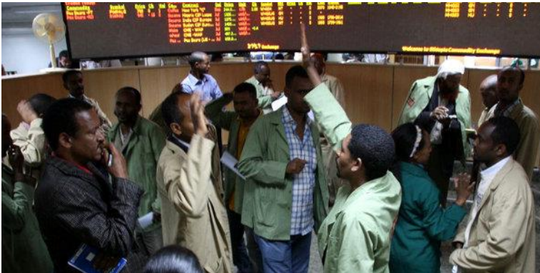
Bourse agricole en Afrique

-Dans le cadre du plan de déploiement de la Bourse agricole de la diaspora et pour commencer par une participation plus large des parties prenantes, nous pensons qu'une conférence virtuelle nous permettra de donner à nos partenaires l'occasion d'avoir un plus grand niveau de participation dans l'élaboration des politiques et des programmes. Cela leur donnera la possibilité de s'appropriier le projet et de s'y impliquer. Cette bourse agricole de la diaspora est un véhicule à utiliser pour combler le fossé entre les producteurs agricoles et les utilisateurs finaux. Cela permet aux producteurs de tirer davantage profit de leurs efforts tout en permettant aux utilisateurs finaux d'avoir un meilleur accès et une meilleure stabilité des prix de l'offre. Cela permettra de relever ainsi de nombreux défis liés à la chaîne d'approvisionnement alimentaire.