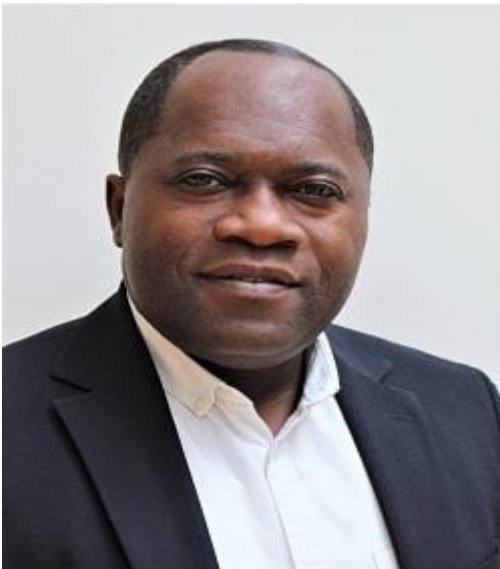
Le Ministre de l'Intérieur, Edgar Ikombo

Comme prévu, les élections ont eu lieu le 1er décembre. Les premiers députés à voter ont été ceux du Japon et de Chine, et les derniers ont été les députés de Hawaï et de la côte ouest des États-Unis. Ce fut donc une très longue journée. Les votes ont été envoyés par voie électronique à myvote@thestateofafricandiaspora.com , un courrier spécialement conçu pour cette circonstance.