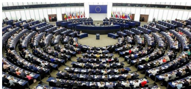
The European Parliament

-la résolution votée au Parlement européen, affirmant que les pays et institutions européens doivent adopter des politiques de restitution et de réparation, - la loi sur la restitution, votée en France, à l'Assemblée nationale