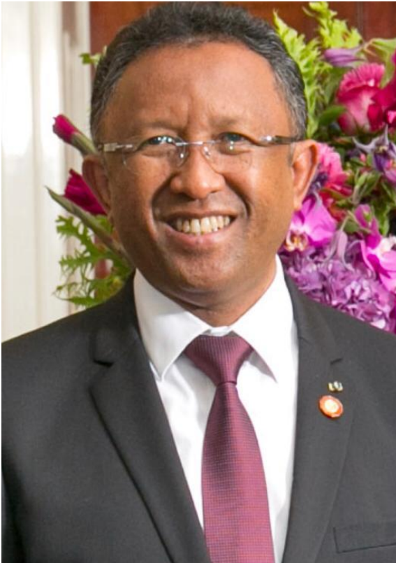
Le président Rajaonarimampianina, ancien président de Madagascar

https://www.jeuneafrique.com/1064342/politique/tribune-colonisation-pour-une-journee-internationale-de-la-reconciliation/