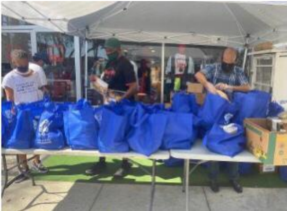
Distribution de nourriture à Los Angeles

joueur de basket-ball, ancien des Lakers de la NBA, Magic Johnson, et une quantité sans précédent de nourriture a été distribuée à 2500 bénéficiaires.