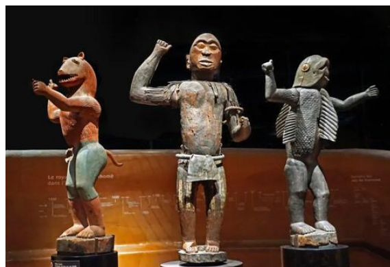
Artefacts royaux volés à Abomey (Bénin) et détenus en France (Musée du Quai Branly)